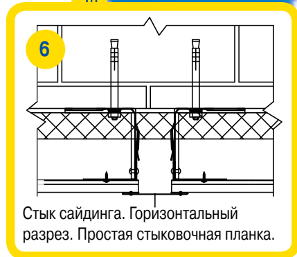
Стык сайдинга. Горизонтальный разрез. Простая стыковочная планка.