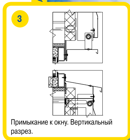
Примыкание к окну. Вертикальный разрез.