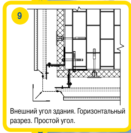
Внешний угол здания. Горизонтальный разрез. Простой угол.