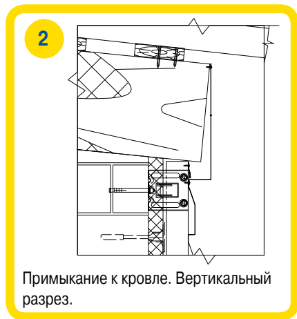
Примыкание к кровле. Вертикальный разрез.