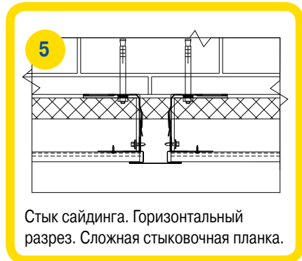
Стык сайдинга. Горизонтальный разрез. Сложная стыковочная планка.