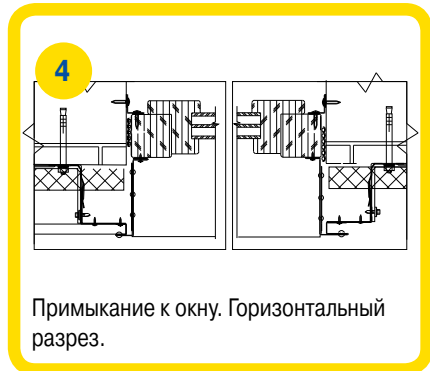
Примыкание к окну. Горизонтальный разрез.