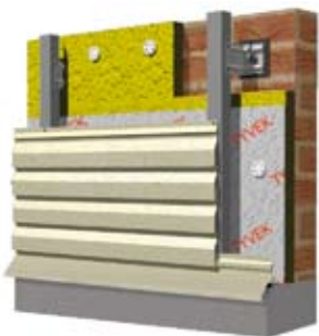
Цокольный слив и начальная планка