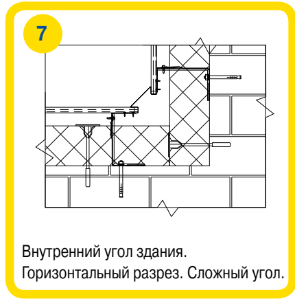
Внутренний угол здания. Горизонтальный разрез. Сложный угол.