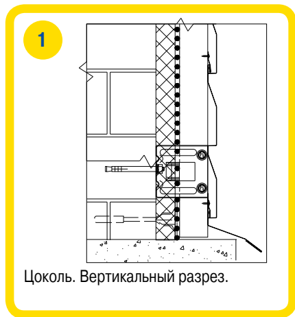
Цоколь. Вертикальный разрез.

Для подшивки карниза удобно использовать профнастил МП-20x1100-А с длиной, равной длине карнизного свеса. Торцы профнастила закрываются планками завершающими сложными.