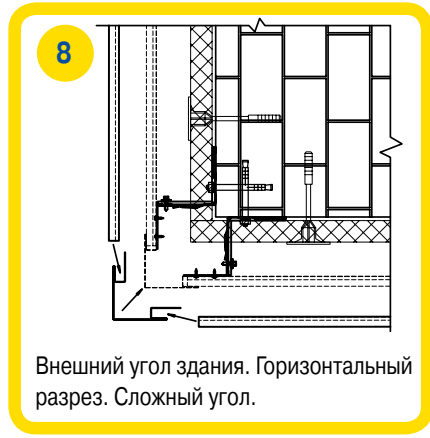
Внешний угол здания. Горизонтальный разрез. Сложный угол.