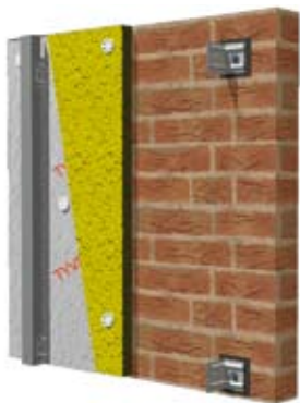
Кронштейны, теплоизоляция, вертикальные профили

Для нормального функционирования системы вентилируемого фасада необходимо оставлять зазоры (минимум 30 мм) для захода и выхода воздуха: у цоколя, под и над окнами, под карнизом крыши.